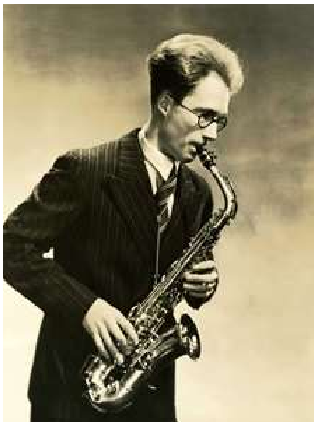
Рис. 1. Сигурд Рашер

Что же Концертштюк Хиндемита, рукопись которого Рашер имел в своем распоряжении? Он несколько раз пытался разучить пьесу вместе со своими учениками, но всегда оставался недоволен их исполнением. Поэтому в течение долгих лет сочинение оставалось лежать в ящике стола. И только спустя почти тридцать лет, когда выучилась и в достаточной мере овладела саксофоном дочь самого музыканта – Карина Рашер, 29 июля 1960 года в Истменской музыкальной школе Нью-Йорка наконец состоялась премьера хиндемитовского опуса. Отметим, что юной исполнительнице тогда было всего 14 лет. Впоследствии Сигурд и Карина Рашер часто включали Концертштюк Хиндемита в программу своих концертов. С тех пор произведение прочно вошло в стандартный репертуарный список всех классических саксофонистов.