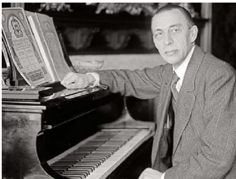
Иллюстрация № 1 - С.В. Рахманинов